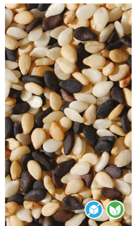
MIX 3 SÉSAMOS