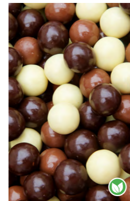
BOLITAS DE CHOCOLATE TRICOLOR*

* Producto sensible a altas temperaturas