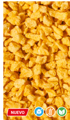
125 gr 608306