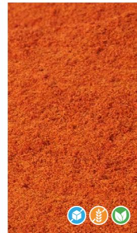
500 gr 608501