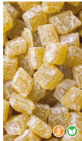
1 kg 601101