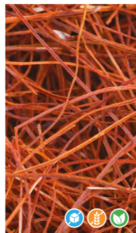
HILOS DE CHILLI