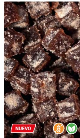
1 kg 601106