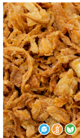
CEBOLLA FRITA EN ESCAMAS