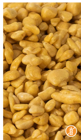
300 gr 608352