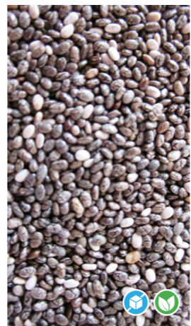
SEMILLAS DE CHÍA