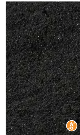
250 gr 608551