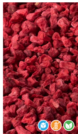
80 gr 608202