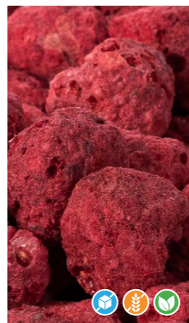
60 gr 608203