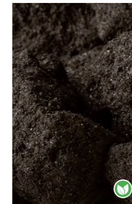
GALLETA CACAO TROCEADA

* Producto sensible a altas temperaturas