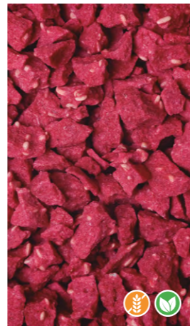
125 gr 608303