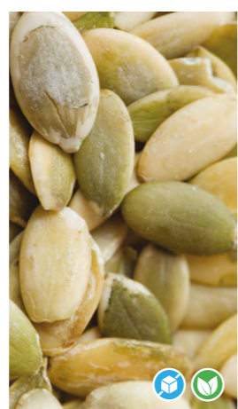
SEMILLAS DE CALABAZA