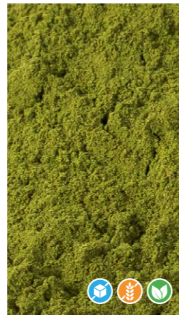
350 gr 608503