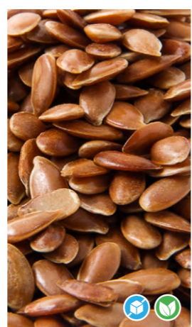
SEMILLAS DE LINO MARRÓN