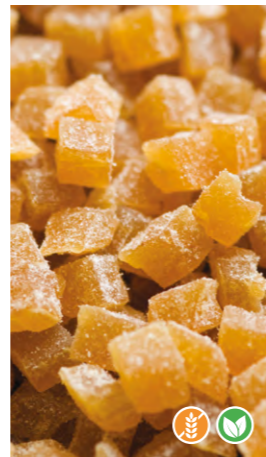
1 kg 601102