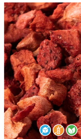
50 gr 608204