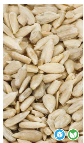
SEMILLAS DE GIRASOL