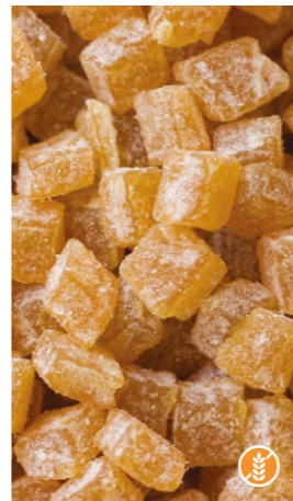
1 kg 601105