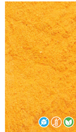
300 gr 608504