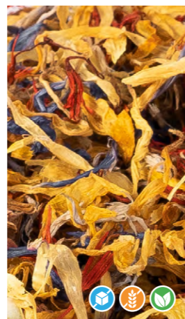
MIX DE FLORES SECAS