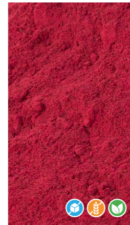
500 gr 608505