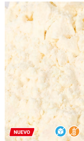
500 gr 608550