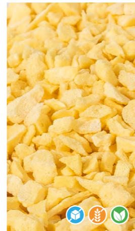
150 gr 608304