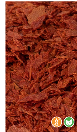
250 gr 608502