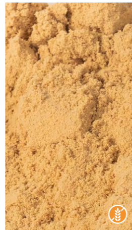
400 gr 608553