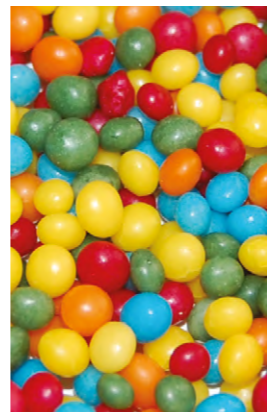
BOLITAS DE COLORES*