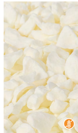
150 gr 608305