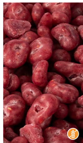
300 gr 608351