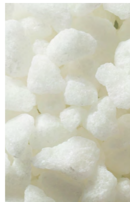
AZÚCAR PERLADO C20