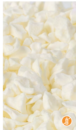
150 gr 608302