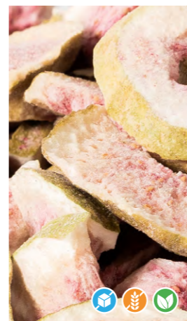
70 gr 608205