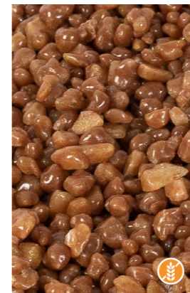
POPPING CANDY CHOCOLATE*

* Producto sensible a altas temperaturas