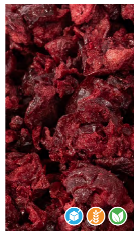
100 gr 608201