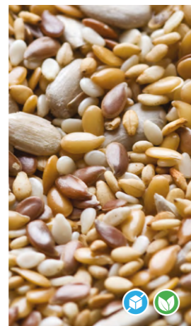
MIX 5 SEMILLAS

Decoración de panes y piezas de repostería. Condimento ideal para ensaladas, decoración de tapas y otras recetas de cocina.