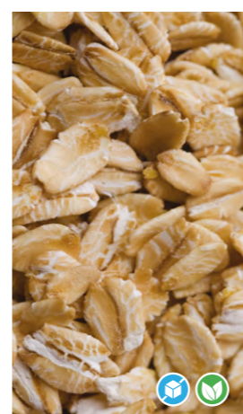
COPOS DE AVENA