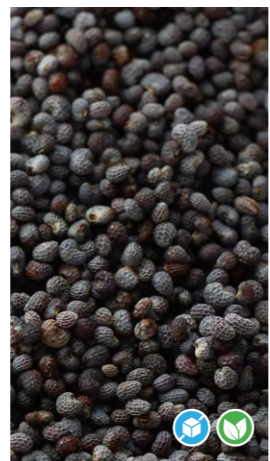
SEMILLAS DE AMAPOLA