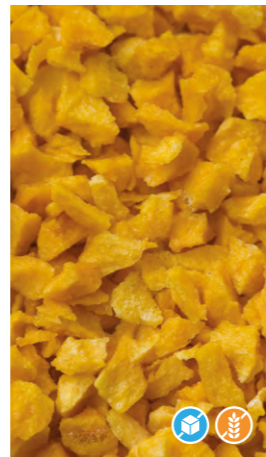
125 gr 608301